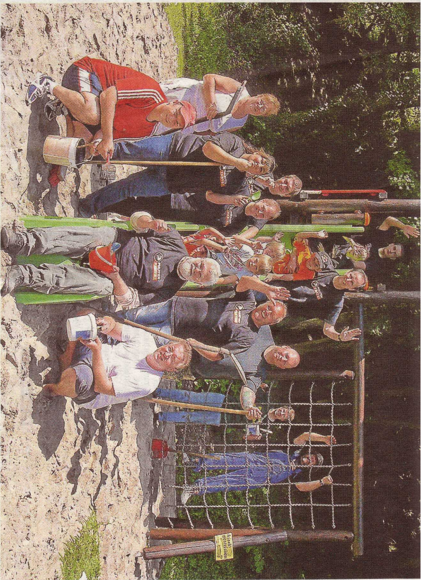
Nach harter Arbeit mit Schaufeln, Farbweimern und anderen Werkzeugen, stellen sich die Bad Bertrich Spielplatzsanierer gut geläut zum Gruppenfoto auf. Klar, denn die Spielgeräte glänzen wie neu.

Nach ihrem Arbeitsinsatz strahlten Bürger, Mütter und Piraten mit den ersten kleinen Testspielen um die Wette: „Wir sind superstolz auf das Ergebnis!“ Was von den Spendengeldern übrig blieb, soll für ein Spielplatzfest investiert werden, das spontan für den 1. September terminiert wurde. Große und kleine Kinder sind willkommen, geplant sind unter anderem Ponyreiten, Schatzsuche, Malwetbewerb und Verkleiden.